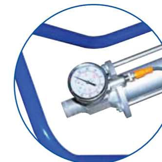
MANOMETR PRO KONTROLU TLAKU