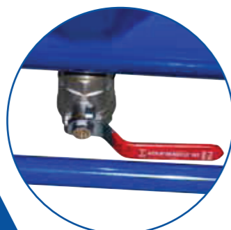
VYPOUŠTĚCÍ OTVOR S UZÁVĚREM