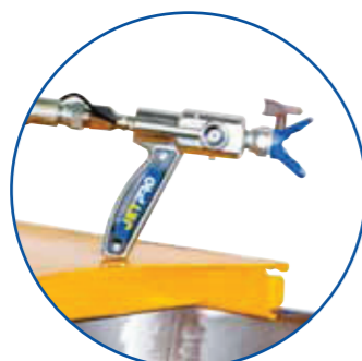
PISTOLE S NOVOU KONSTRUKCÍ