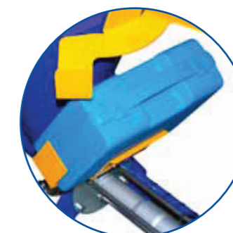
DRŽÁK PRO KUFŘÍK STRYSKOU