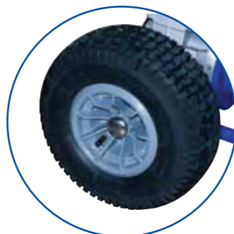
NAFUKOVATELNÁ KOLA S VELKÝM PRŮMĚREM Ø300MM